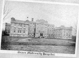
Grace Maternity Hospital