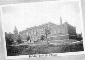
Public Health Clinic