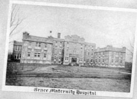
Grace Maternity Hospital